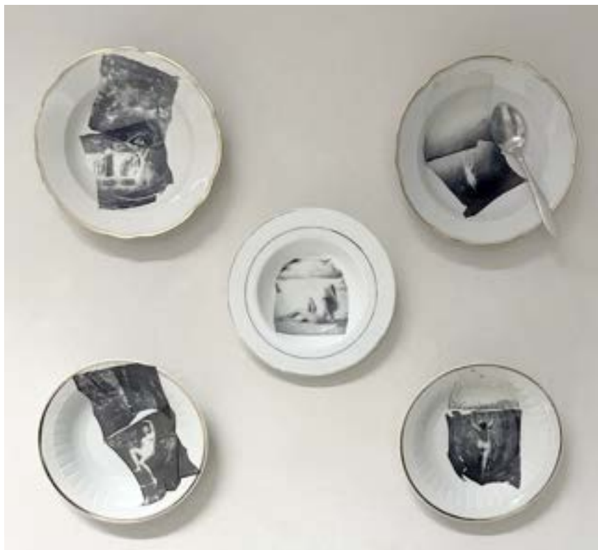
Polaroidtransfer na talerzu. średnica ok 24 cm 2024

Niedziela to dla wielu z nas czas odprawiania rodzinnych rytuałów: poranne nastawianie rosółu, dźwięk ubijanego schabu, wizyta w kościółku i wspólne siedzenie przy stole. Dlaczego jednak te spotkania nie przypominają amerykańskich filmów pełnych dialogów i śmiechu? Przy stole często panuje swoisty klimat napięcia; każdy stara się stwarzać pozory, że jest taki, jakiego oczekują inni. Kurtuazja, zaciśnięte dłonie, napięta żyła na skroni, zaciśnięte zęby. Wszystko należy "zamieść pod dywan" i udawać kochającą się rodzinę. W swojej pracy wracam do symbolu tych spotkań — talerza na zupę. Talerza, w którym powinien znajdować się rosół — taki z domowym makaronem, który od razu brudzi męskie koszule. Ale w moich talerzach rosół już nie zagości. Są za to marzenia o niedzieli, podczas której bez świadków, ocen, zasad, można pójść i doświadczać życia. Zdjąć wszystkie tabu, oczekiwania i wrócić do swojego naturalnego domu. Wybrać się na randkę ze sobą, naturą, światem — wolnością.